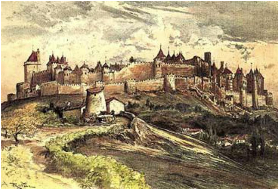
Peinture Alfred de Robinda—1895

La Cité, un site inscrit dans une certaine permanence dans le temps : plus de 2000 ans d'histoire, de l'époque romaine à aujourd'hui.